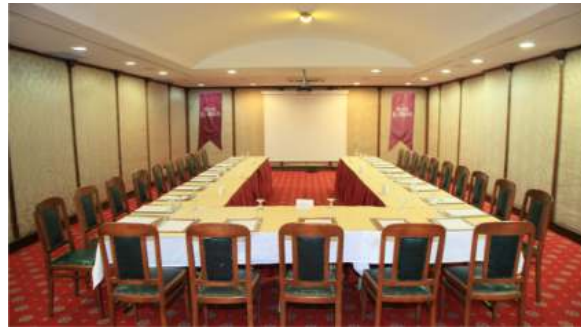
Karakoyn Toplantı Salonu