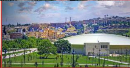
Şanlıurfa Tarihi Kent Merkezinde KEYİFLİ BİR GEZİ