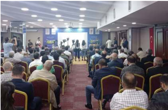
Çevre Bakanlığı İklim Değişikliği Bilgilendirme, Bilinçlendirme ve Eylem Planı Semineri" Hotel El-Ruha'da