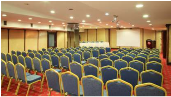
Kızılkoyn Toplantı Salonu