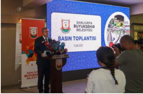
Şanlıurfa Büyükşehir Belediyesi 2022 Yılı Faaliyet Değerlendirme Basın Toplantısı Hotel El-Ruha'da