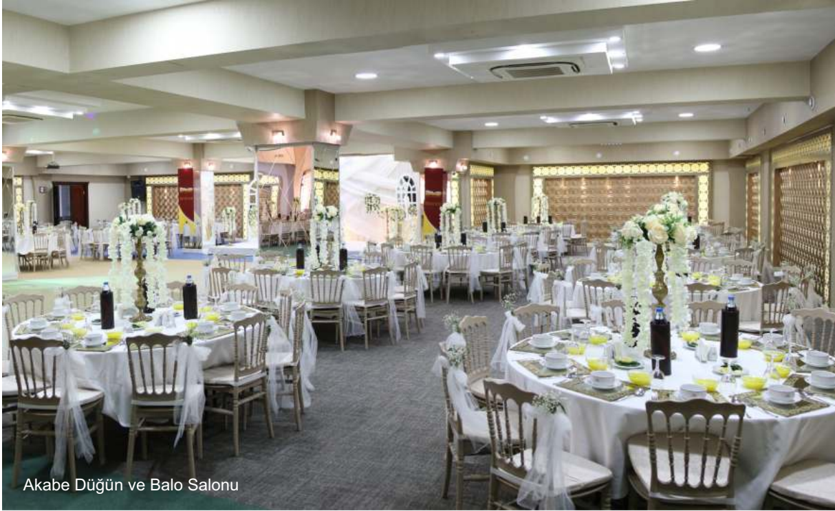
Akabe Düğün ve Balo Salonu