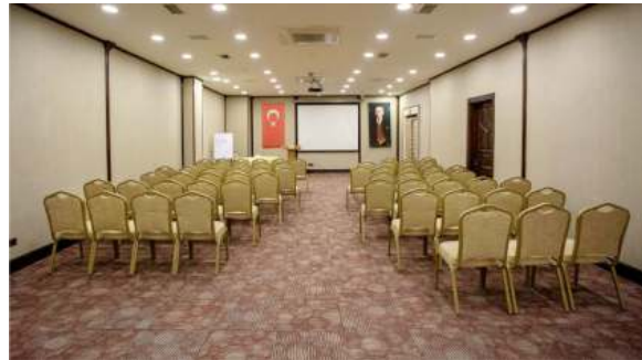
Rehavi Toplantı Salonu