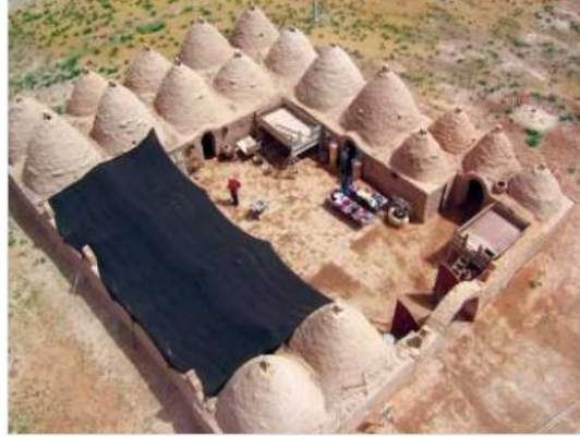
HARRAN KÜMBET EVLERİ