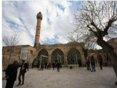
YUSUF PAŞA CAMİ