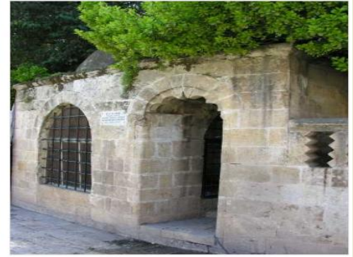
ŞAZELİ ALİ DEDE TÜRRESİ