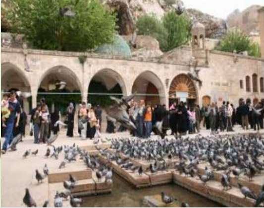
MEVLİD-İ HALİL CAMİİ