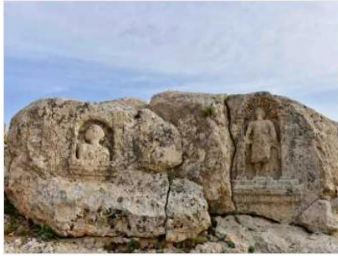
SOĞMATAR ANTİK KENTİ