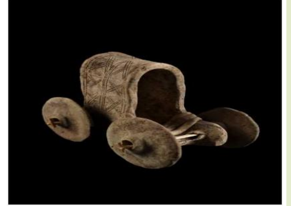
ŞANLIURFA ARKEOLOJİ MÜZESİ