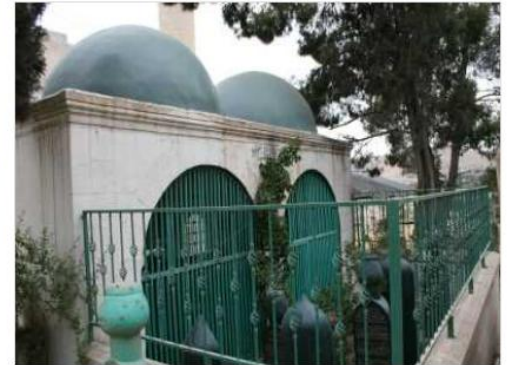
NEBİH EFENDİ TÜRRESİ