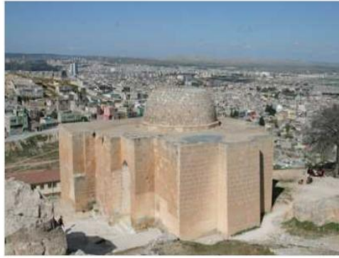
ŞEYH MES'UD TÜRRESİ