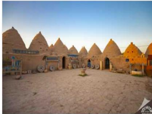
HARRAN ÖREN YERİ